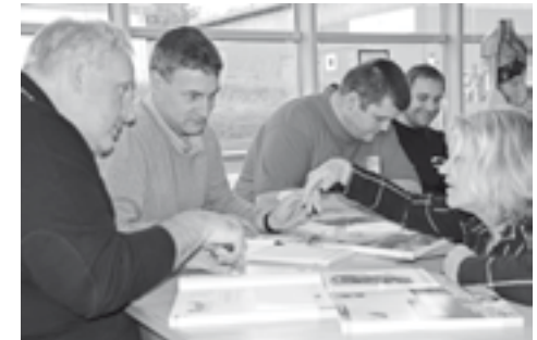
Kleingruppenarbeit – es wird an der richtigen Aussprache gefeilt.

Niveau A1 erreicht. Es wird nicht nur strikt nach Lehrbuch gelernt sondern vielmehr wird auch Landeskunde und landestypische Kultur vermittelt ebenso wie fachbezogenes Dänisch. Ganz besonders ist anzuerkennen, dass alle Teilnehmer die Sprachausbildung neben ihrer eigentlichen beruflichen Tätigkeit ehrenamtlich ausüben. Parallel zu den Dänischkursen in Deutschland finden auch die Deutschkurse in Dänemark statt. Besonders erfreulich ist es, dass die Anmeldungen zum ersten Kurs die Kapazität um das doppelte überschritten haben. So ist es notwendig geworden, einen Extrakurs im kommenden Jahr durchzuführen.