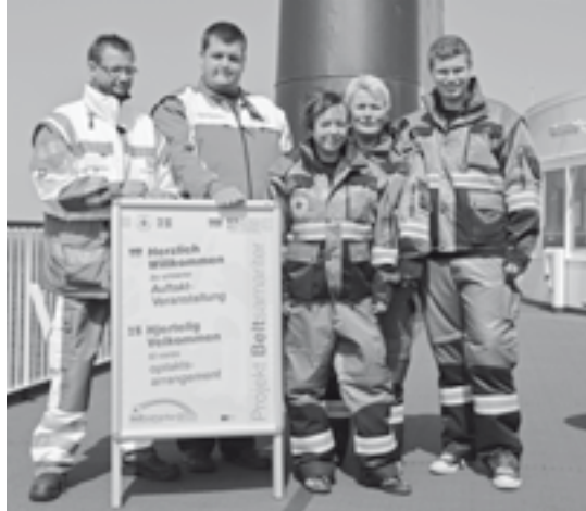
Fünf Beltsamariter bei der Projekt-Vorstellung im Mai auf der Fähre.

arbeitet. Ausgehend vom Zirkusgebäude, dem Ort an dem ein Arbeitsunfall im Jahre 1907 zur Gründung von Dansk Folkehjaelp führte, wurde der Sitz des dänischen Parlamentes (Folketing) im Schloss Christiansborg besichtigt, ebenso wie der historische Hafen Nyhavn, das Schloss Amalienborg als Wohnsitz der dänischen Königsfamilie. In Kleingruppen wurde mit jeweils zwei dänischen und deutschen Samaritern dann noch die Innenstadt erkundet. Der Abend stand im Zeichen des gemeinsamen Kennenlernens, des Anwendens der erworbenen Sprachfähigkeiten und der Hygge, also klassischer dänischer Gemütlichkeit. Am Sonntag wurde gemeinsam gefrühstückt und anschließend in den Kleingruppen über Vorurteile gegenüber der anderen Nation gesprochen. Das Besondere hieran war, dass die Ergebnisse nicht aufgeschrieben, sondern gezeichnet worden sind. Bevor es nach einem gemeinsamen Mittag-