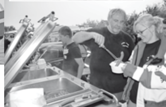
Verpflegung für hungrige HelferInnen