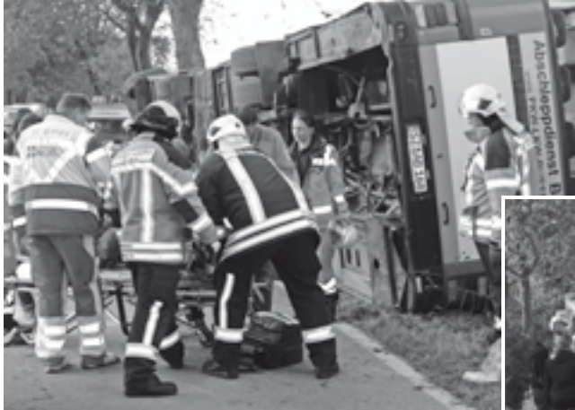
Bilder von der Übung „Busunfall“ im Oktober 2012 bei Damlos.