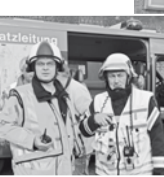
Bilder von der ...