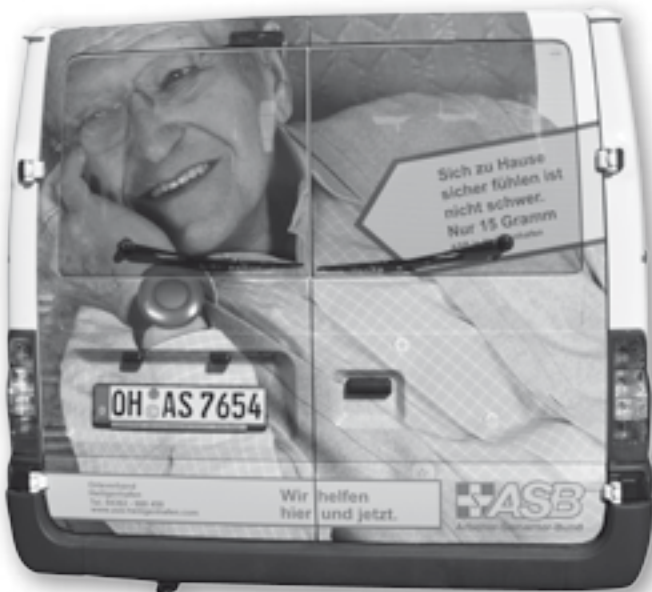
Die Heckklappe unseres neuen Ford-Kleinbusses weist auf unser Hausnotruf-System hin.

Falls kein Festnetz-Telefonanschluss vorhanden ist, stellt der ASB gern ein spezielles Gerät zur Verfügung, welches eine Verbindung über ein Funktelefon-Netz herstellt.