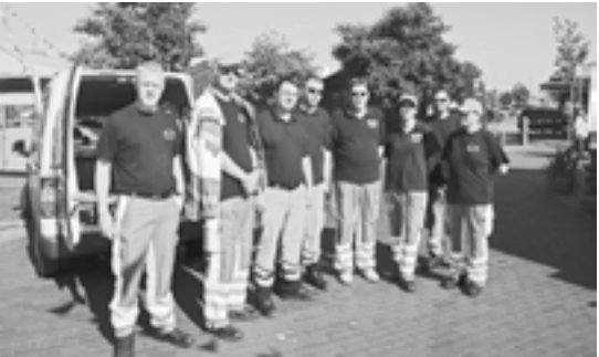
Das Team „Fischerman“ bei Dienstbeginn.

Ein weiteres größeres Event war die Betreuung des Fisherman-Triathlons am Heiligenhafener Hafen und in der Innenstadt. Aus Sicht des ASB besteht bei dieser Veranstaltung für die Absicherung der Radfahrer noch Verbesserungsbedarf. Der PKW-Verkehr müsste aus einigen neuralgischen Punkten wie zum Beispiel dem Wilhelmsplatz vollkommen herausgehalten werden.