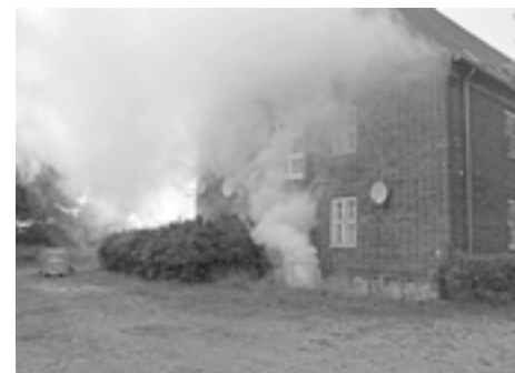
Das Wohngebäude „brennt“.

Zum Abschluss der Übung gab es aus der ASB-Feldküche Verpflegung und es fand im Gerätehaus der Großenbroder Wehr die Abschlussbesprechung statt. Alle Beteiligten inklusive der Verletztendarsteller gaben zu verstehen, dass die Übung trotz des ersten Hintergrunds eine interessante Erfahrung und der Zusammenarbeit förderlich war.