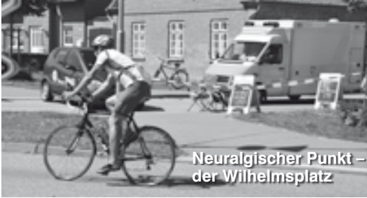
Neuralgischer Punkt - der Wilhelmsplatz

Ebenfalls ein Fußball-Spiel, wenn auch nicht auf dem Platz sondern auf dem Riesenschildschirm, wurde am 9. Juni im Rahmen der Fußball-EM an der neuen Seebrücke vom ASB betreut. NDR II hatte zum Public Viewing eingeladen. Über 1.000 Fußballfans folgten der Einladung zum Vorrundenspiel Deutschland gegen Portugal. Es gab keine Vorfälle.