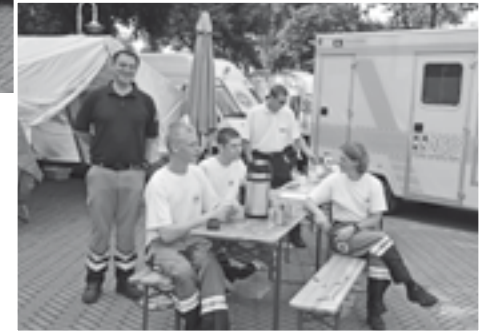
Altstadtfest Burg (rechts)

Anfang August weilten im Gegenzug drei ASB-Sanitäter auf der dänischen Insel Seeland und halfen bei der Betreuung eines mehrtägigen Großflohmarkts mit. Ebenfalls im August fand der Großenbroder Sundlauf statt – der ASB war wieder mit dabei.