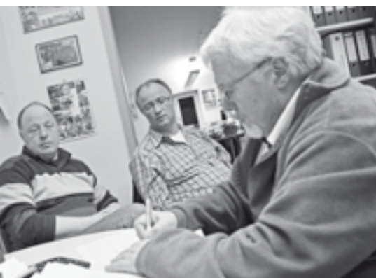
Prüfung der Ortskontrollkommission.

von Unterlagen der Geschäftsführung und des Vorstands gehören zum Aufgabenbereich der OKK. Es wird stichprobenartig geprüft. Gerade im finanziellen Bereich arbeitet unsere Buchhaltung eng mit dem ASB-Landesverband zusammen. Dieser wird wiederum von einer Buchprüfungsfirma und der Landeskontrollkommission kontrolliert. Der Möglichkeit von Unregelmäßigkeiten sollte also hinlänglich vorgebeugt sein.