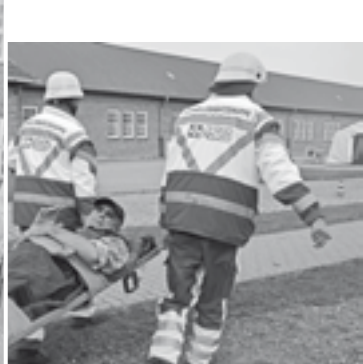
... Übung bei CPKelco