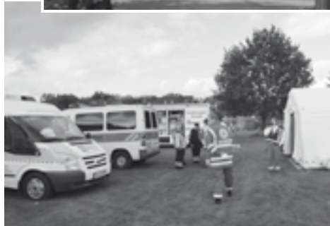
Verbandsplatz. Alle Hilfsorganisationen waren auch hier vertreten.