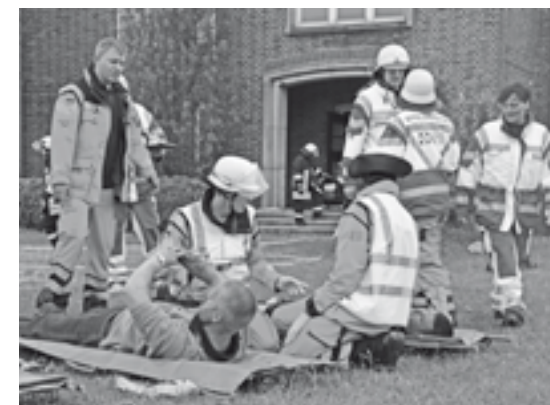
Verletztensichtung durch die SEG.

Ausgeglichen wurde die Bilanz ein wenig durch die Teilnahme an zwei größeren Übungen. Zunächst wurde im Juli gemeinsam mit der Freiwilligen Feuerwehr Großenbrode auf dem Gelände der Fa. CPKelco geübt. Angenommene Übungslage war, dass ein Weltkriegsblindgänger explodiert ist, 15 Bewohner eines Mehrfamilienhauses haben dabei mittelschwere und schwere Verletzungen erlitten. Ausgear-