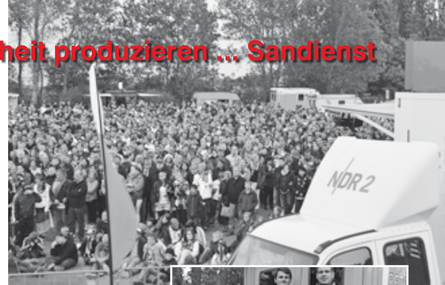
Public Viewing mit dem NDR bei der Fußball-EM an der neuen Seebrücke.