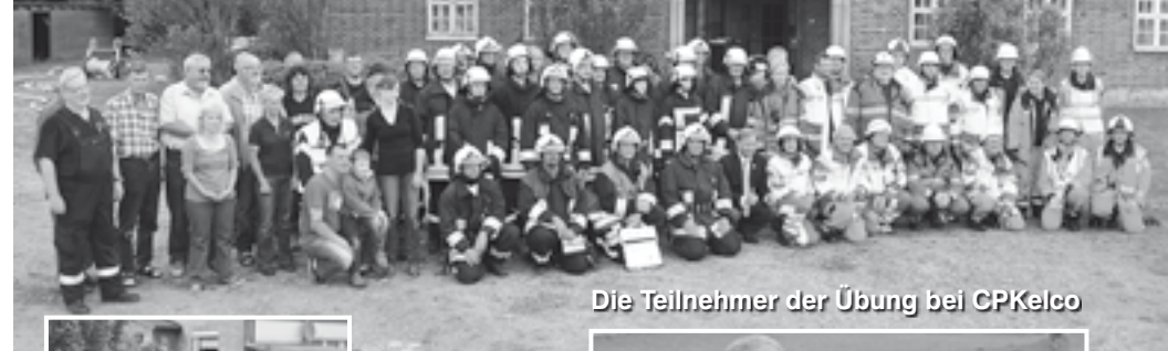
Die Teilnehmer der Übung bei CPKelco