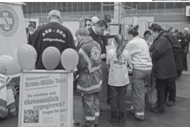
Der ASB-Messestand hatte guten Zulauf.

Bereits zum 4. Mal beteiligte sich unser Ortsverband an der Ehrenamtmesse, die am 4. März 2012 wiederum in Oldenburg stattfand. Wie schon im Jahre 2010 haben sich ASB und ASJ an einem Doppelstand präsentiert. Unsere Helferinnen und Helfer boten wiederum den beliebten Erste-Hilfe-Test an und informierten mit einer Bildshow sowie Prospektmaterial über die Tätigkeit des ASB Heiligenhafens. Luftballons konnten an die kleinen Besucher verteilt