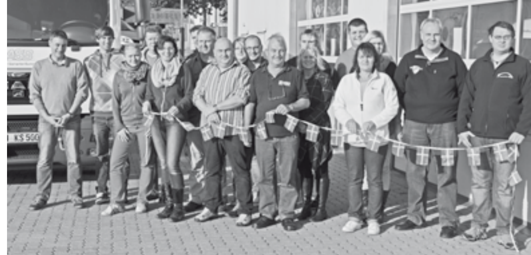
Die Teilnehmer des ersten Dänisch-Kurses der Beltsamariter.

Am 20. Oktober ist der erste Dänischkurs auf deutscher Seite gestartet. 16 angehende Beltsamariter werden in den Räumen unseres Ortsverbands von der Dänischlehrerin Annemette Knudsen-Fischer unterrichtet. Die Kurse finden in Form von Wochenendkursen statt und werden bis zum Erreichen des Niveau A2 des europäischen Referenzrahmens für Sprachen durchgeführt, sie umfassen ungefähr 120 Unterrichtseinheiten. Bis zur Weihnachtspause haben die Teilnehmer des Pilotkurses schon das